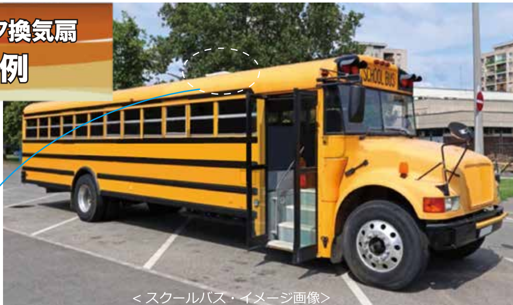
<スクールバス・イメージ画像>